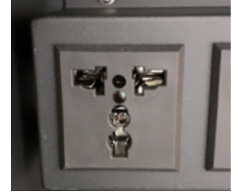
40 AC universal mixed socket to supply up to 14" devices 40 prises mixtes universelles pour alimenter les appareils jusqu'à 14"