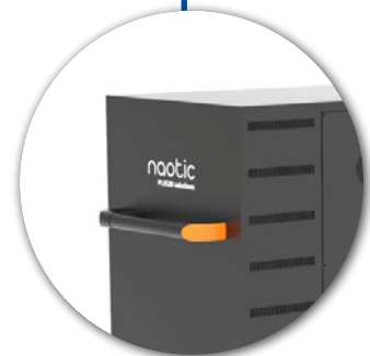
Ergonomic side bar Barres latérales ergonomiques

FOR TABLETS, NOTEBOOKS & ELECTRONIC DEVICES UP TO 14"