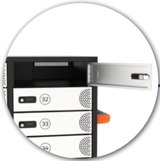
Individual lockable doors Portes individuelles verrouillables