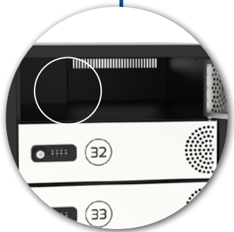
1 AC universal power sockets per door 1 prise de courant électrique universelle par casier